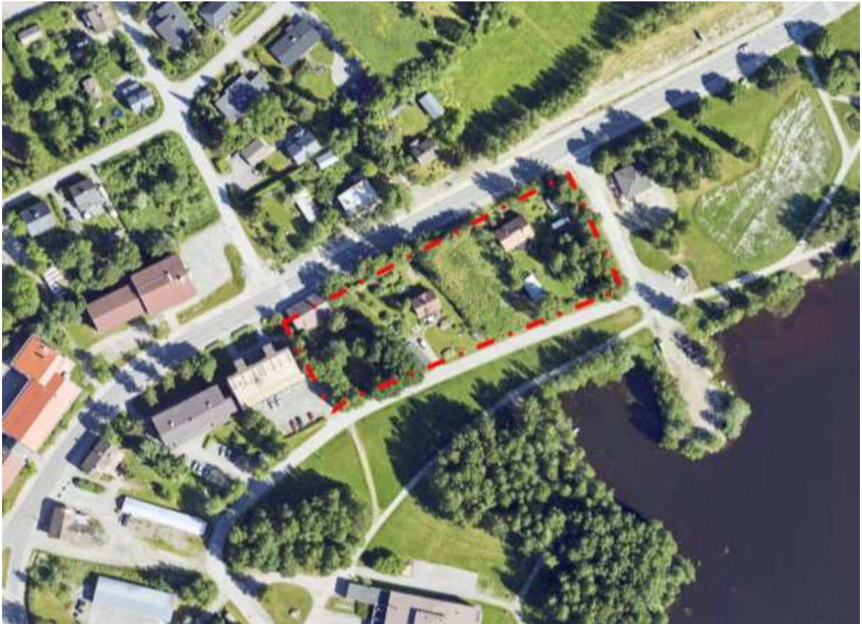
Kuva 1: Kaavamuutosalueen sijainti ilmakuvassa

Osallistumis- ja arviointisuunnitelmaa (OAS) päivitetään tarpeen mukaan koko suunnittelutyön ajan ja on nähtävillä kaupungin verkkosivuilla sastamala.fi .