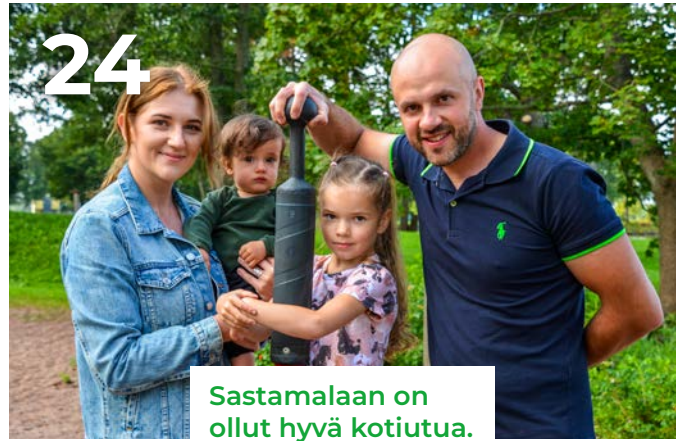
Sastamalaan on ollut hyvä kotiutua.