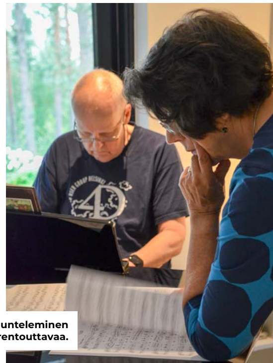
Myös kuunteleminen on rentouttavaa.