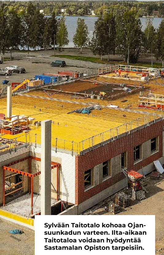
Sylvään Taitotalo kohoaa Ojan-suunkadun varteen. Ilta-aikaan Taitotaloa voidaan hyödyntää Sastamalan Opiston tarpeisiin.

vaikka öljyn vaihdon tai jarruremontin opettelemisen. Kenttä on tosi monipuolinen, Kuusela kertoo.