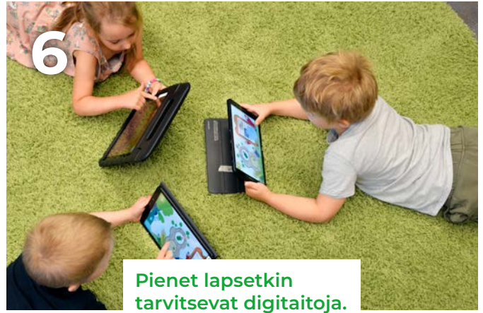
Pienet lapsetkin tarvitsevat digitaatioja.