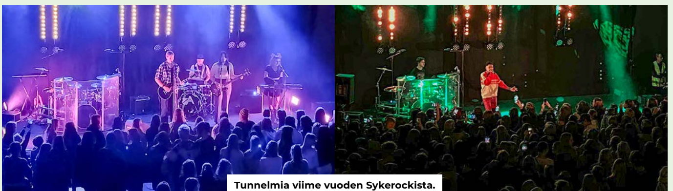
Tunnelmia viime vuoden Sykerockista.