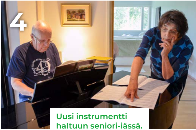
Uusi instrumentti haltuun seniори-iässä.