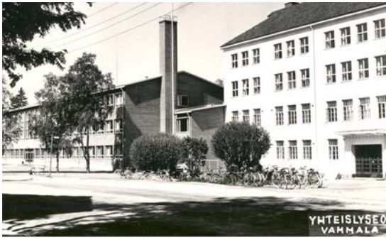
Ylempi kuva: Sotilastoimintaa Tyrvään Yhteiskoululla. Alempi kuva: Kuvassa vanha Yhteiskoulun rakennus ja vuonna 1962 valmistunut tiilinen siipirakennus, jota kutsuttiin ”uudeksi puoleksi”.