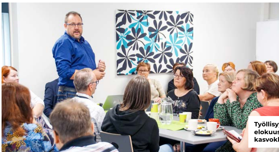
Työllisyyspalveluiden henkilökunta tapasi elokuussa Sastamalassa ensimmäistä kertaa kasvokkain.

– Jatkossa meillä on käytettävissä paremmat tiedot niin alueen työvoimatarpeesta kuin työvoimareservistä. Paikallisen tietämyksen lisääminen edesauttaa sitä, että pystytään tekemään oikeita toimenpiteitä sekä niille, jotka tarvitsevat työvoimaa että niille, jotka ovat työn puutteessa, Malmberg vakuuttaa.