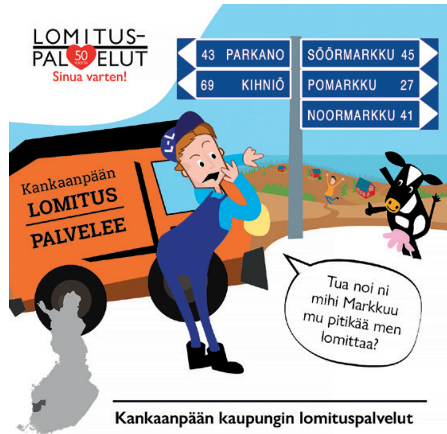
Kankaanpään kaupungin lomituspalvelut