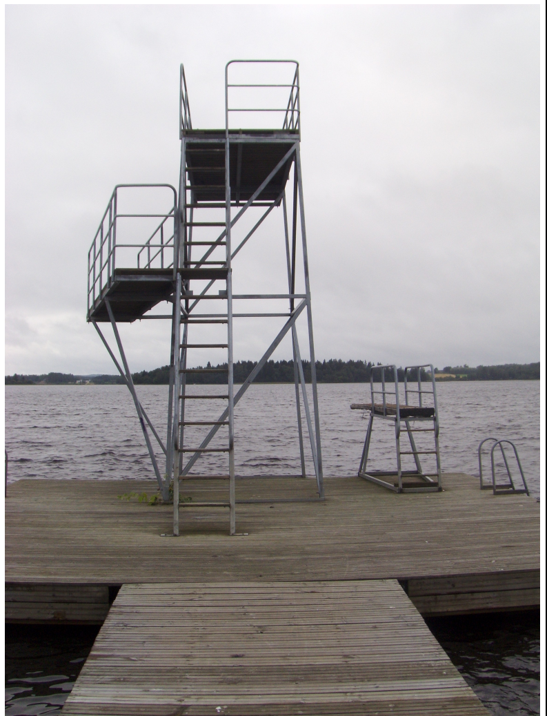
Toivolansaaren uimarannan hyppytorni.