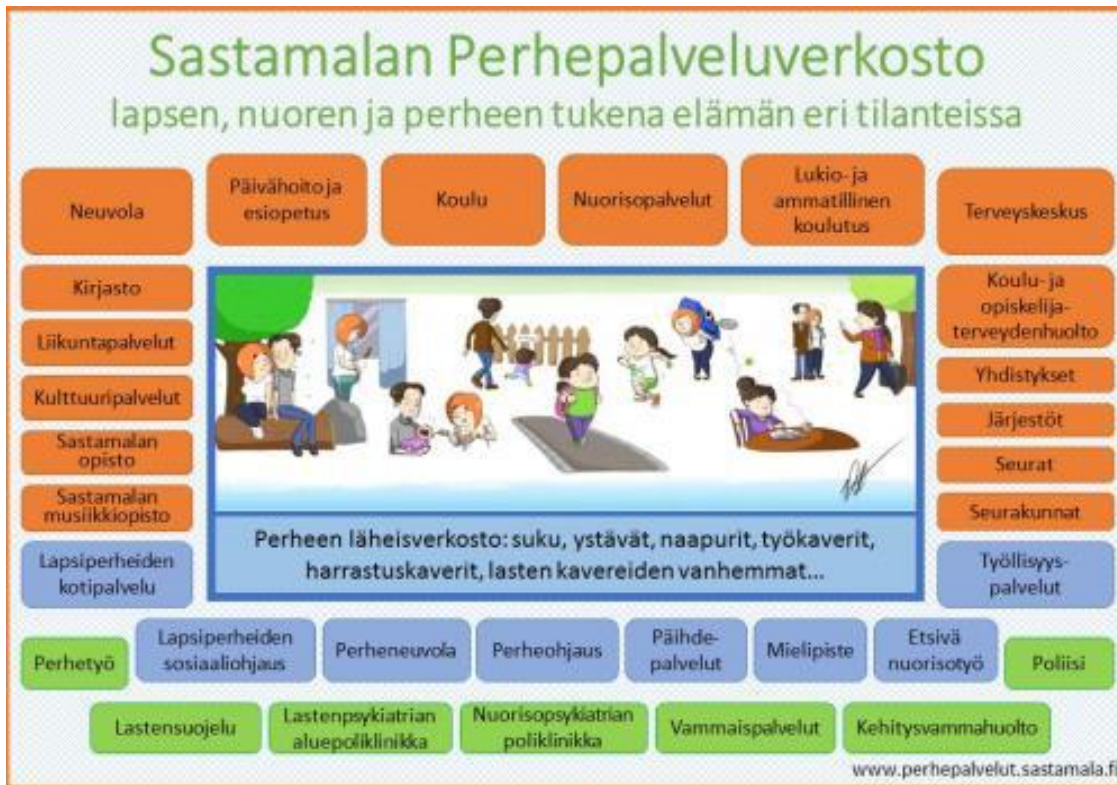
Kuvio 2 Sastamalan perhepalveluverkosto

Moniammatillisen yhteistyön tavoitteena on aina lapsen etu. Eri alojen ammattilaiset tuovat keskusteluun oman näkemyksensä ja niiden avulla luodaan lapsen kasvua ja kehitystä tukevia tavoitteita. Moniammatillisen yhteistyön toteutumista arvioidaan säännöllisesti ja systemaattisesti. Palautetta kerätään monipuolisesti eri yhteistyötahoilta.