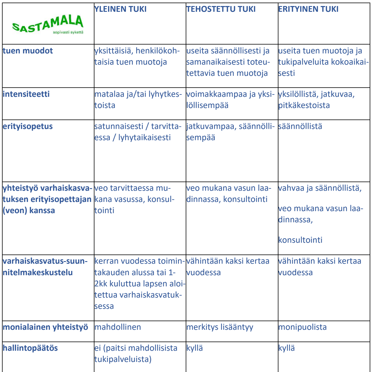
Taulukko. Kolmiportaisen tuen toteuttaminen Sastamalassa

Mikäli lapselle on suositeltu pidennettyä oppivelvollisuutta, sen toteuttamisen periaatteet ja käytännöt on kuvattu Sastamalan kaupungin esiopetussuunnitelmassa.