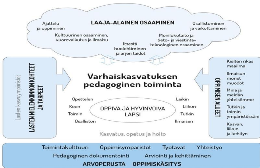
Kuvio 3. Varhaiskasvatuksen pedagogisen toiminnan viitekehys

Varhaiskasvatuksen pedagogista toimintaa ja sen toteuttamista kuvaa kokonaisvaltaisuus. Tavoitteena on edistää lasten oppimista ja hyvinvointia sekä laaja-alaista osaamista (kuvio 3).